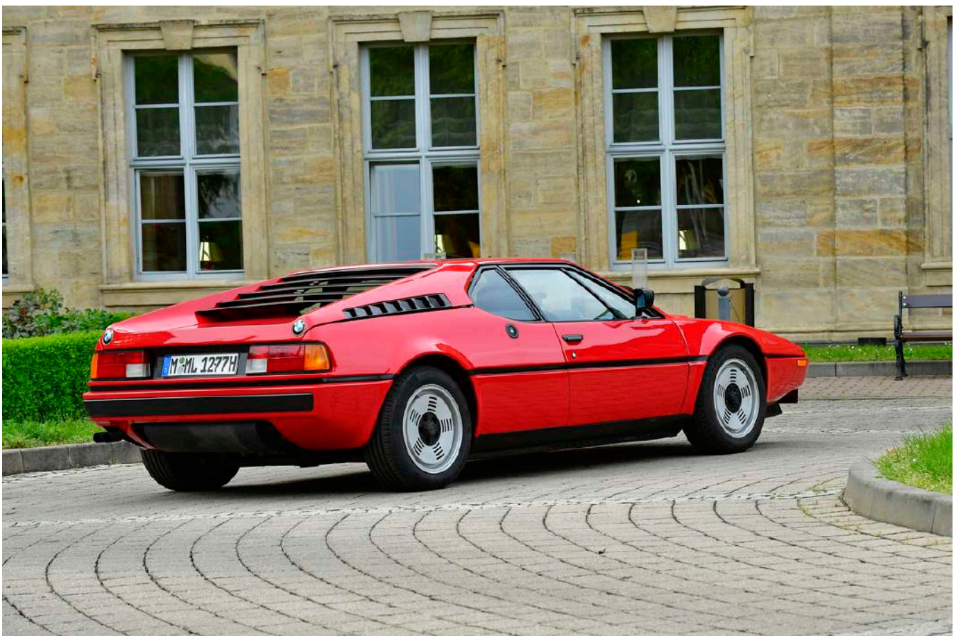
BMW M1 E26

El BMWCCB - BMW Car Club Brasil, fue fundado en Noviembre de 1999, en São Paulo, por aficionados al automóvil de la marca alemana BMW, inicialmente creando la división de Autos dentro del ya existente Club de Motos BMW Clube do Brasil, actual BMW Motorrad Clube Brasil.