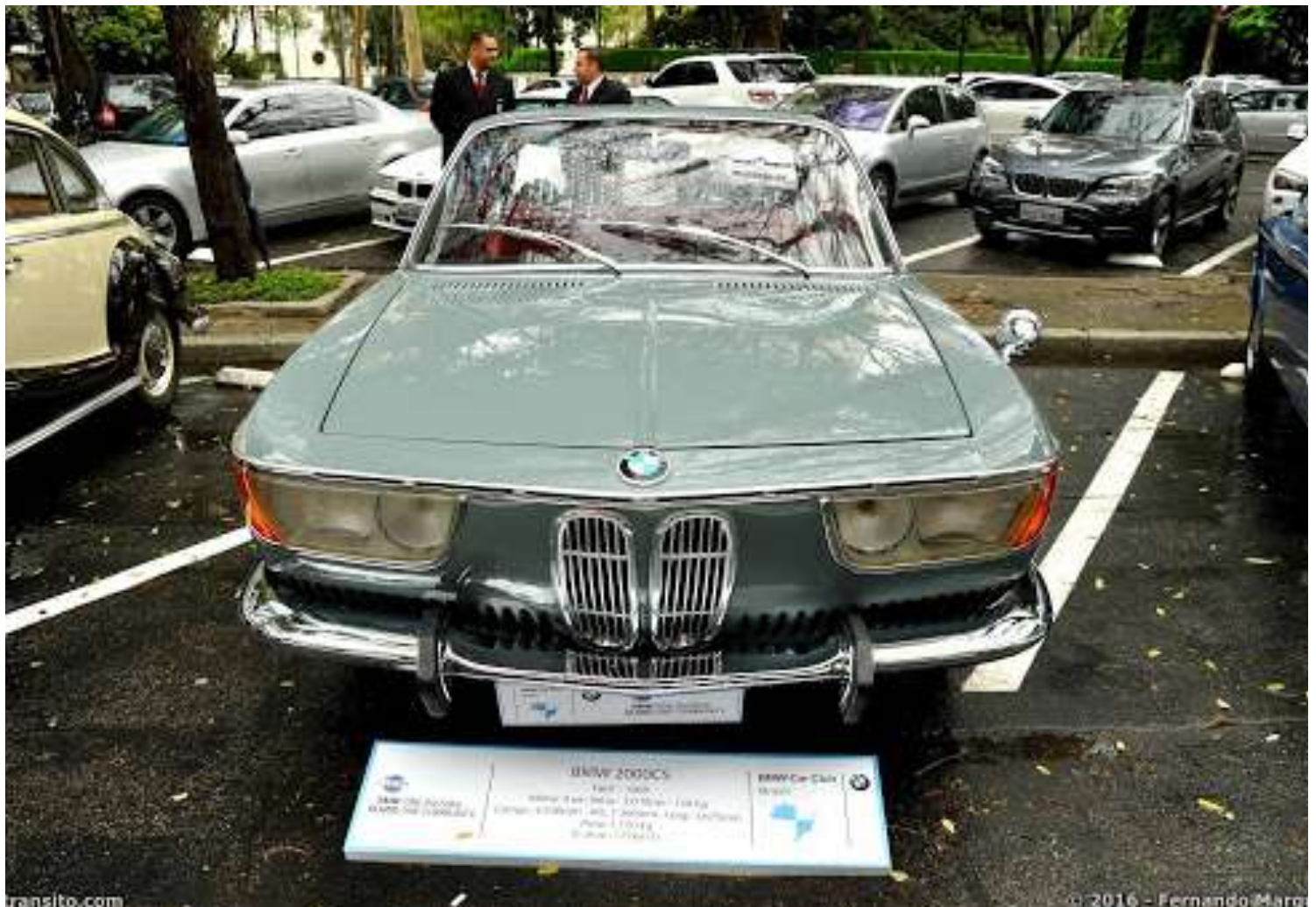
Exposición BMW 100 Años - Shopping Iguatemi São Paulo - Sep 2016

En 2019, el BMWCCB recibió una nueva y actualizada Certificación de BMWCLAF - BMW Clubs Latin America Federation, reiterando su posición como el único Club BMW Oficial de Autos en Brasil.