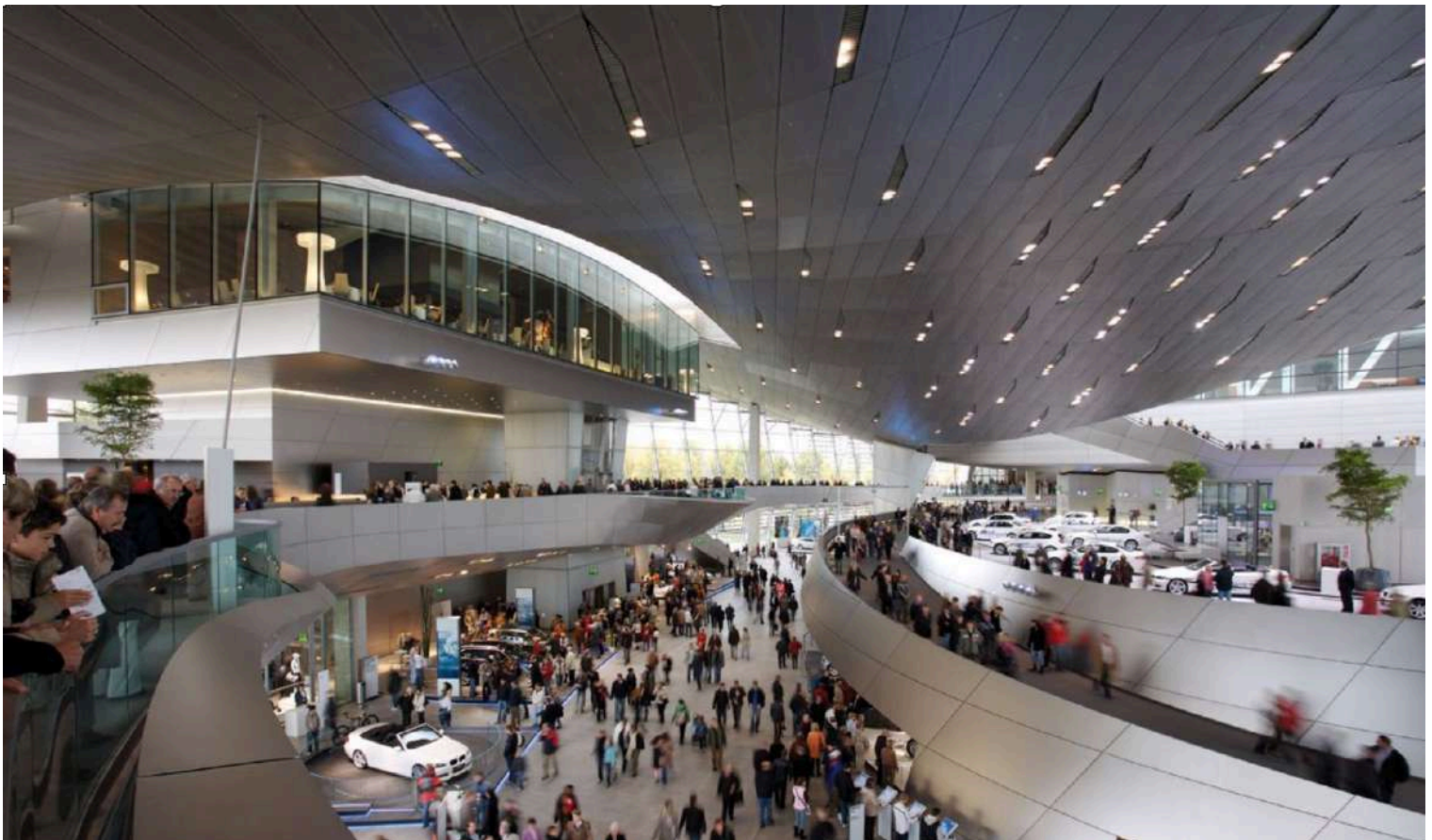
BMW Welt - Vista Interna

BMW Welt abrió sus puertas el 20 de octubre de 2007, la culminación de años de planificación. Después de que la decisión de construir BMW Welt fuera aprobada a fines de la década de 1990, la siguiente pregunta candente fue la elección de un sitio adecuado. Era evidente que el nuevo centro de eventos y entrega tenía que construirse en un lugar lleno de historia, cerca de los edificios actuales de BMW.