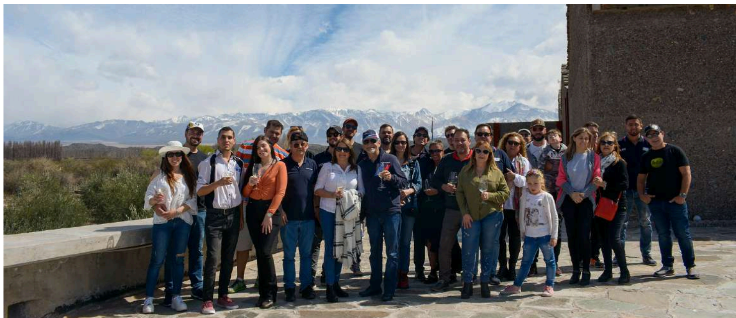
BMW Auto Club Mendoza - Encuentro Septiembre 2019

Participar en eventos relacionados con la marca.