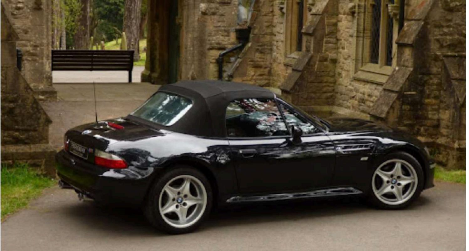
BMW M Roadster E36/7