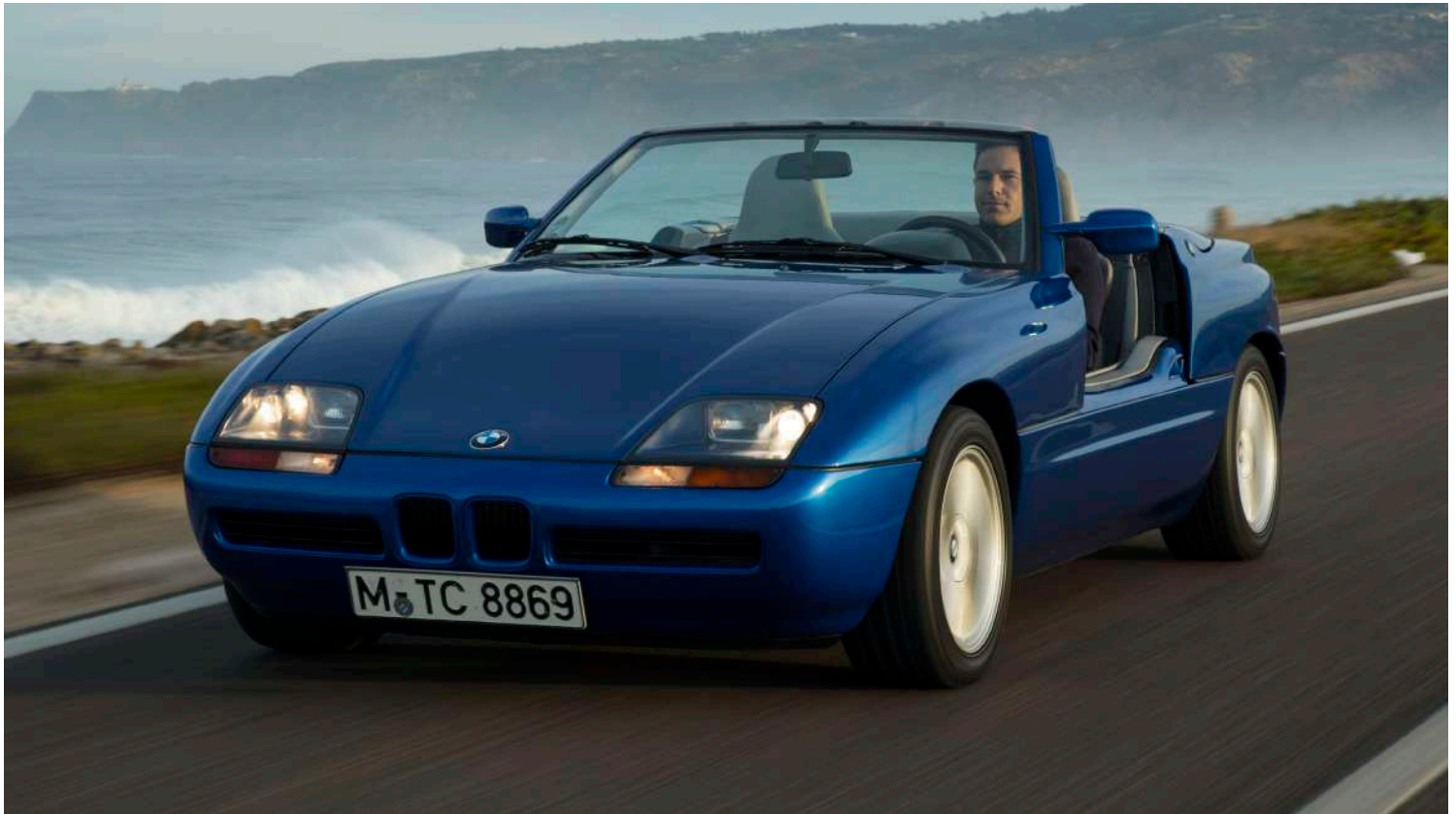
BMW Z1 E30/Z - Puertas abajo