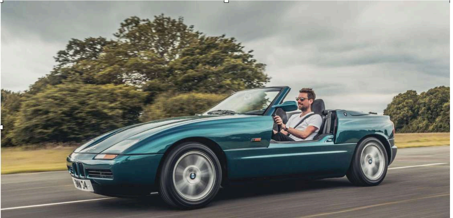
BMW Z1 E30/Z - Puertas abajo