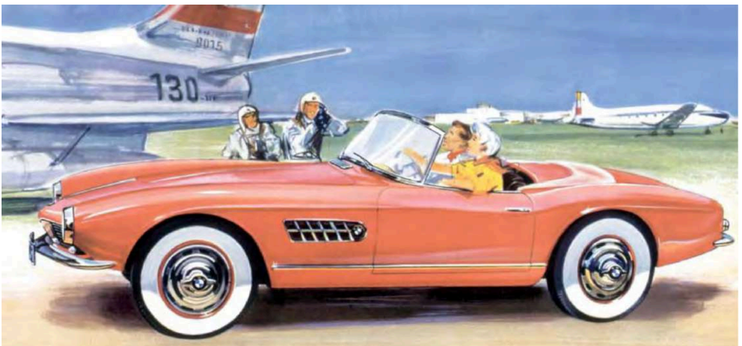
BMW 507 V8 - Catálogo de ventas