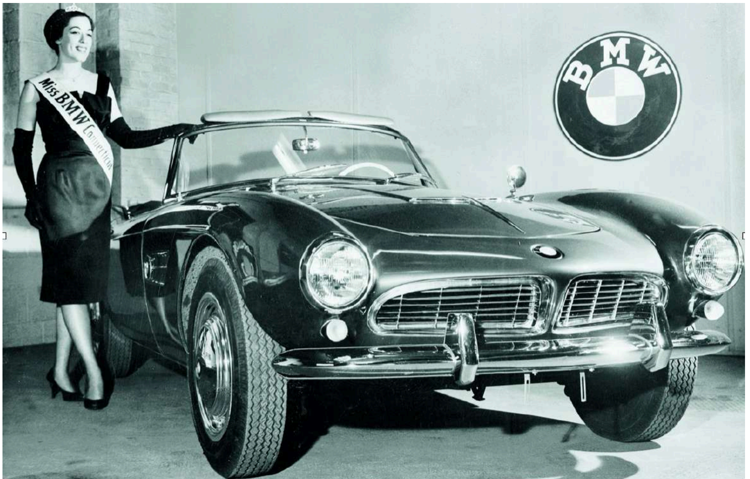
BMW 507 V8 y la Miss BMW