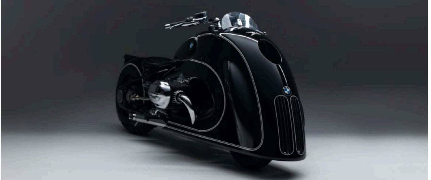
BMW R18 Custom Bike