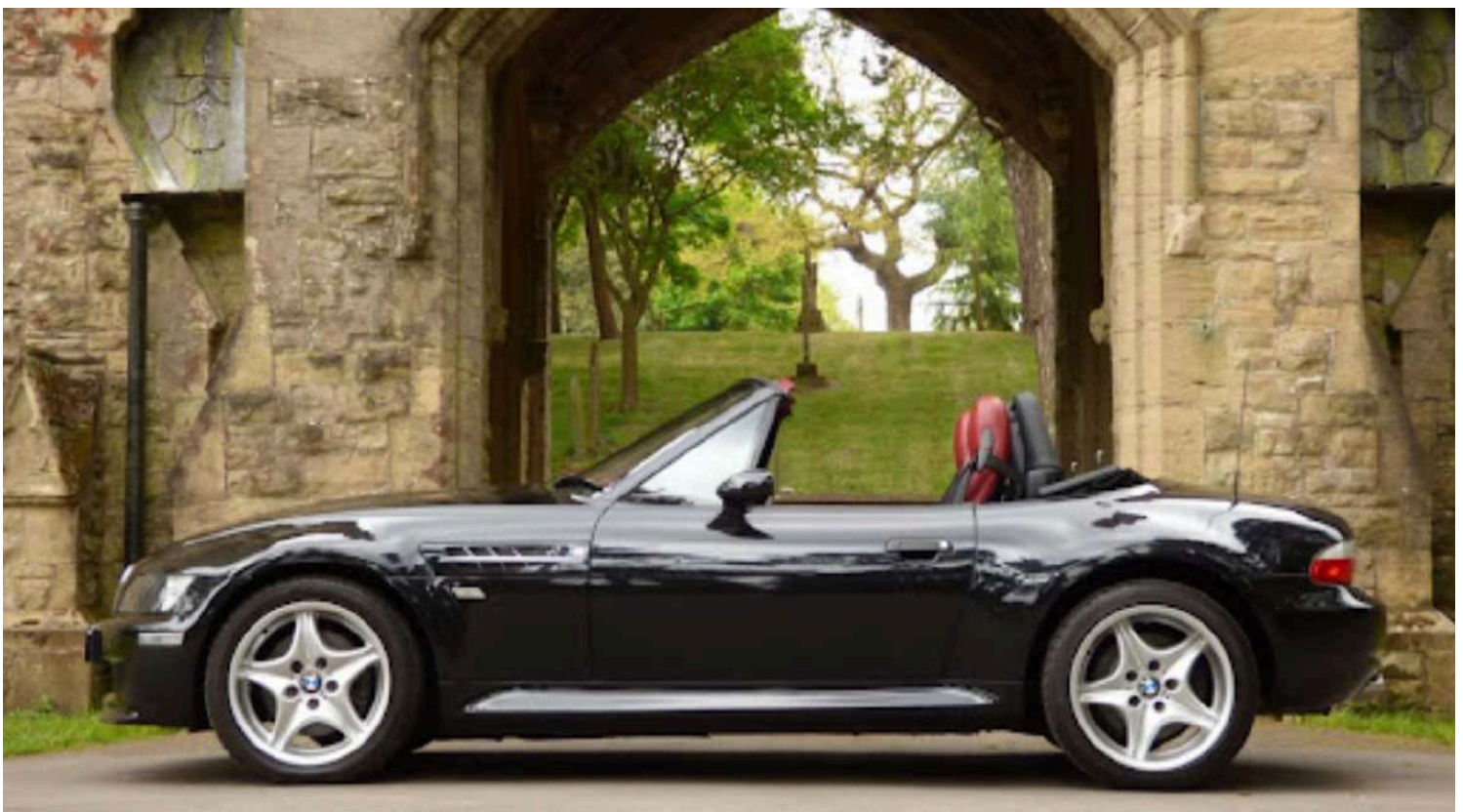
BMW Z3 M Roadster E36/7