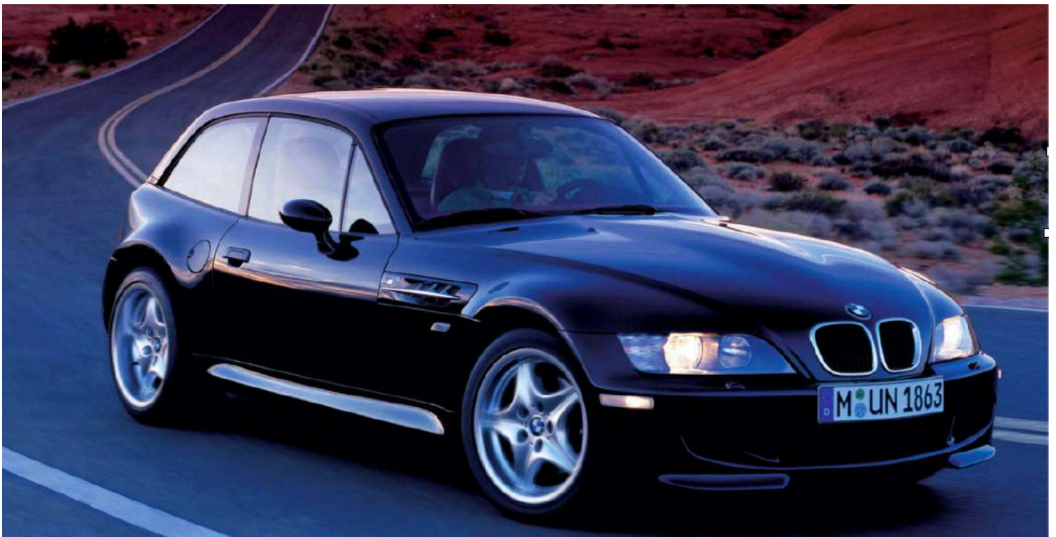
BMW M Coupe E36/8