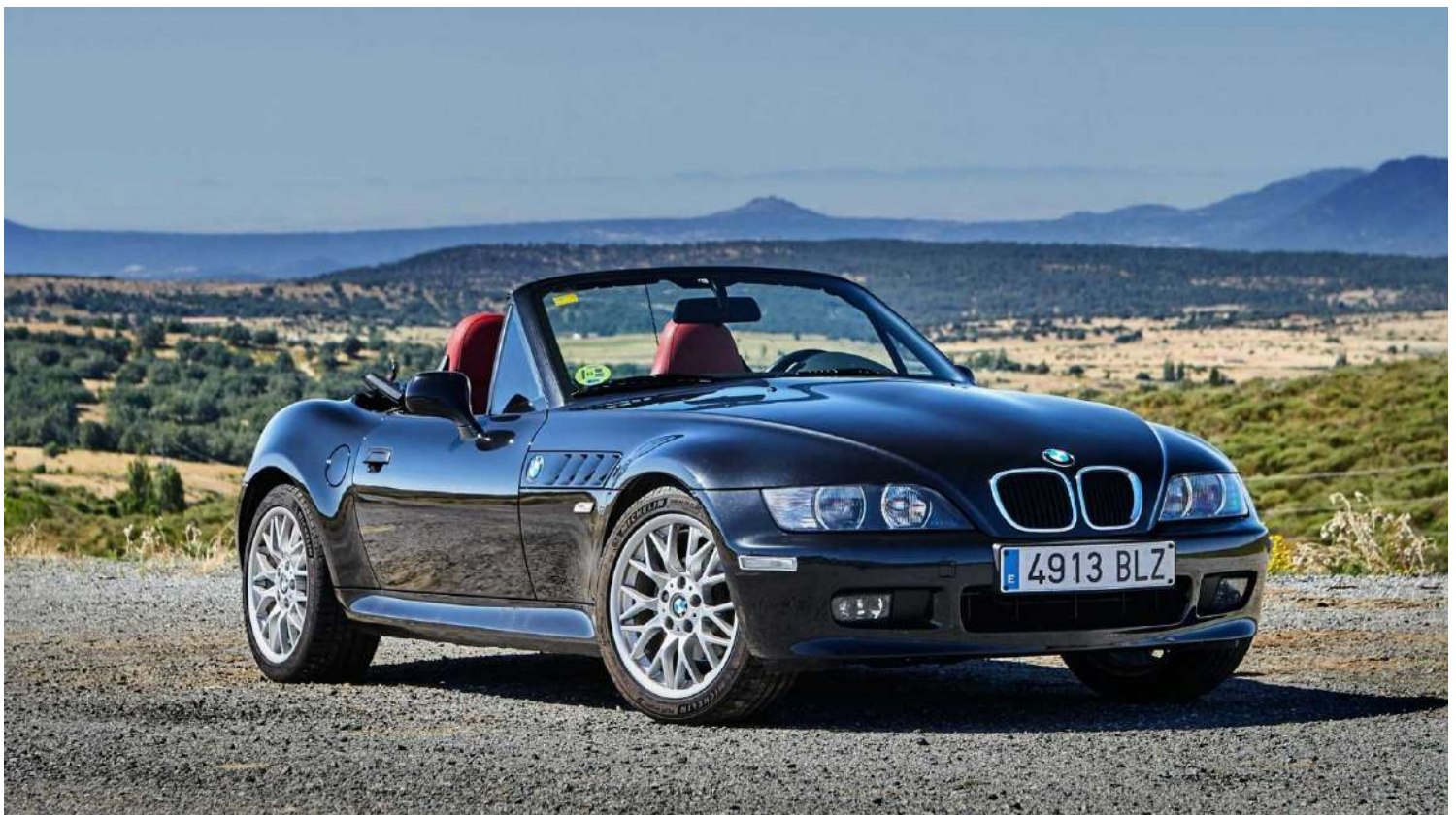
BMW Z3 3.0 E36/7

En 2021 celebramos los 25 años de su lanzamiento, ya es un auténtico deportivo clásico.