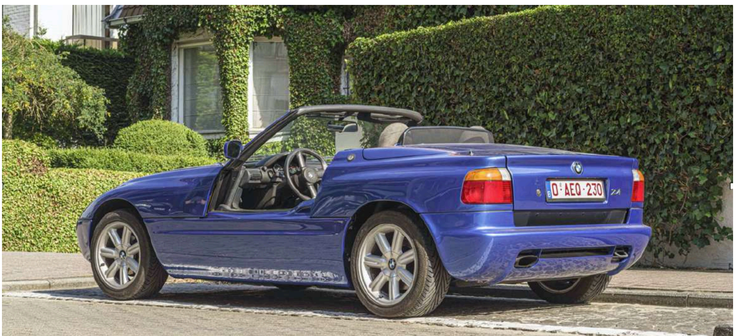
BMW Z1 E30/Z - Puertas abajo