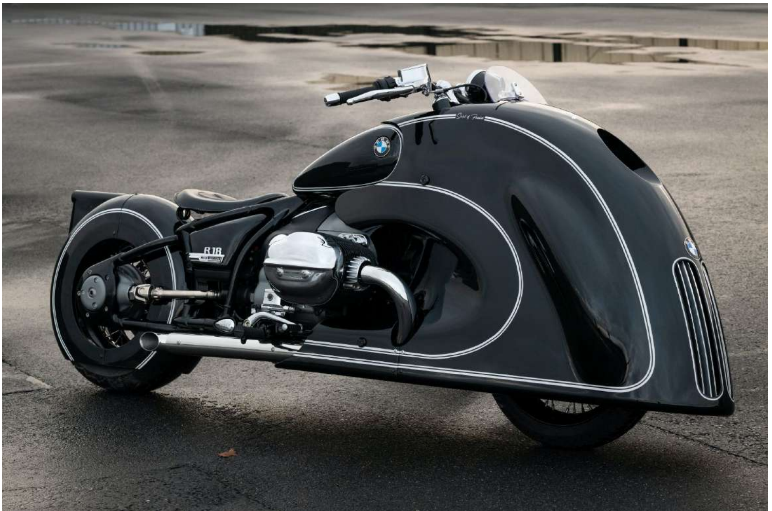
BMW R18 Custom Bike

Es una obra de arte sobre dos ruedas y llama mucho la atención recordando el diseño retro de los años 30 y la parrilla de riñón del BMW 328.