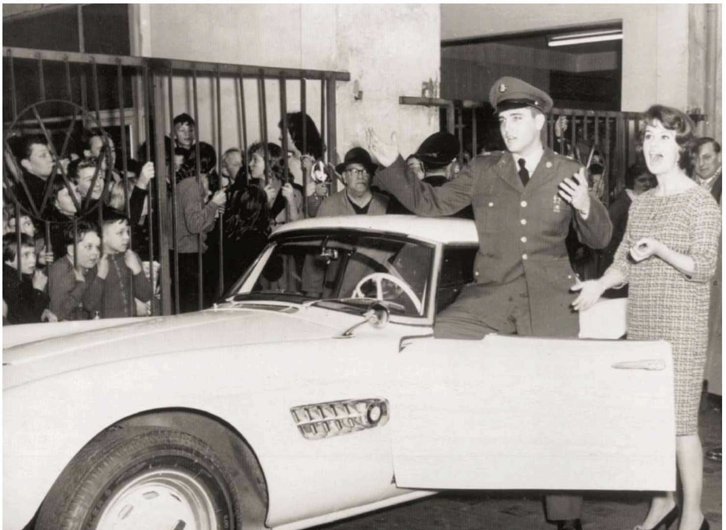
Elvis Presley's BMW 507 V8

La foto histórica de abajo inmortalizó este modelo, que fue recientemente adquirido por BMW en los EUA y completamente restaurado por la fábrica en su color blanco original.