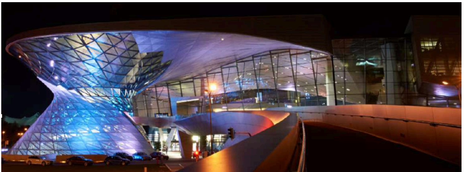
BMW Welt - Vista Frontal

En BMW Welt, se proporciona un entorno de trabajo seguro para los empleados y socios que promueve la salud y la excelencia. Además, dado que es un lugar público, también toman muy en serio responsabilidad con los visitantes y se esfuerzan por proporcionar una experiencia segura y ecológica para los visitantes hasta el último detalle.