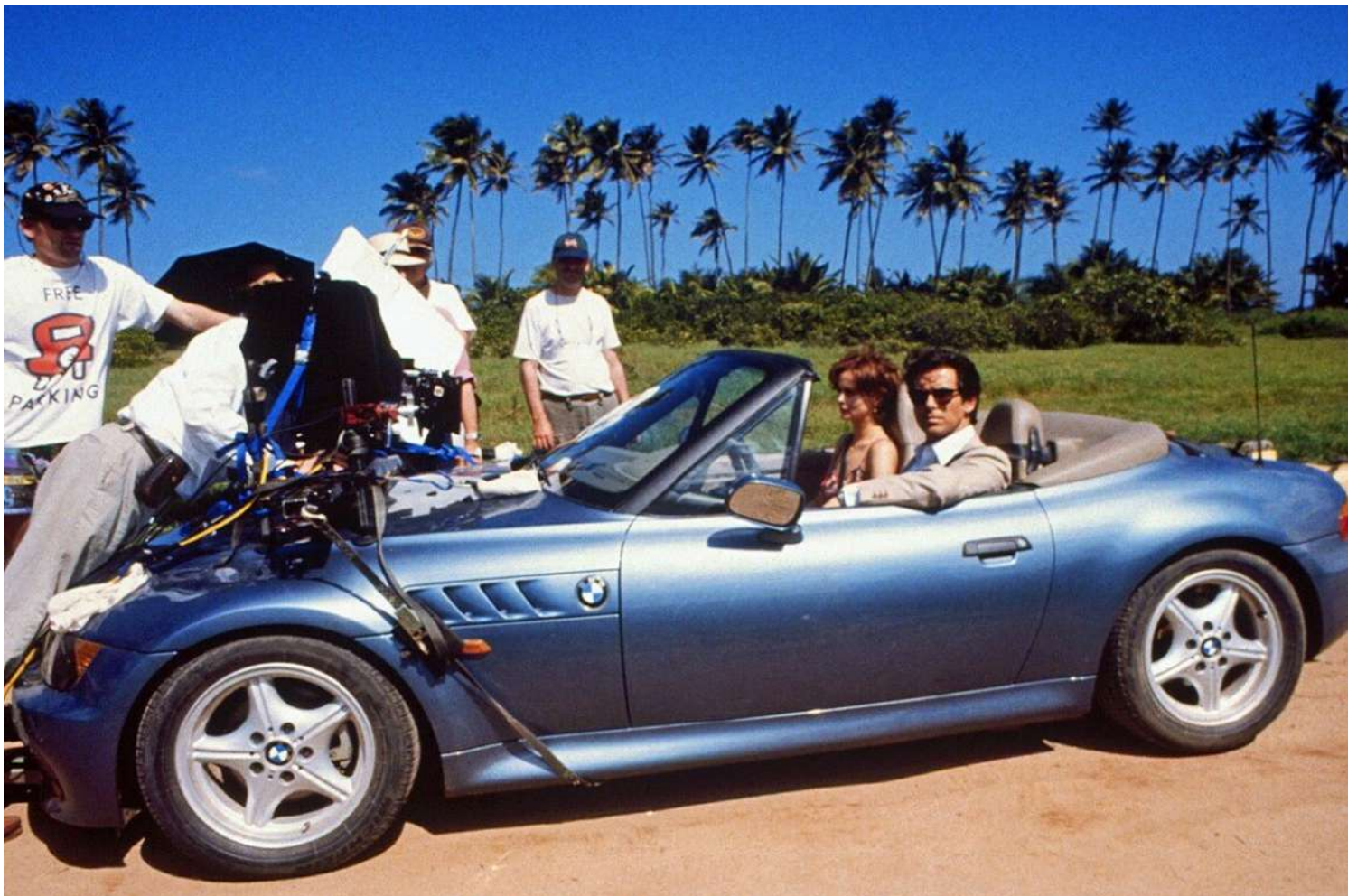
BMW Z3 E36/7 - James Bond 007

El Coupe se fabricó a partir de enero de 1998 y su chasis era 2,7 veces más rígido que el Roadster.