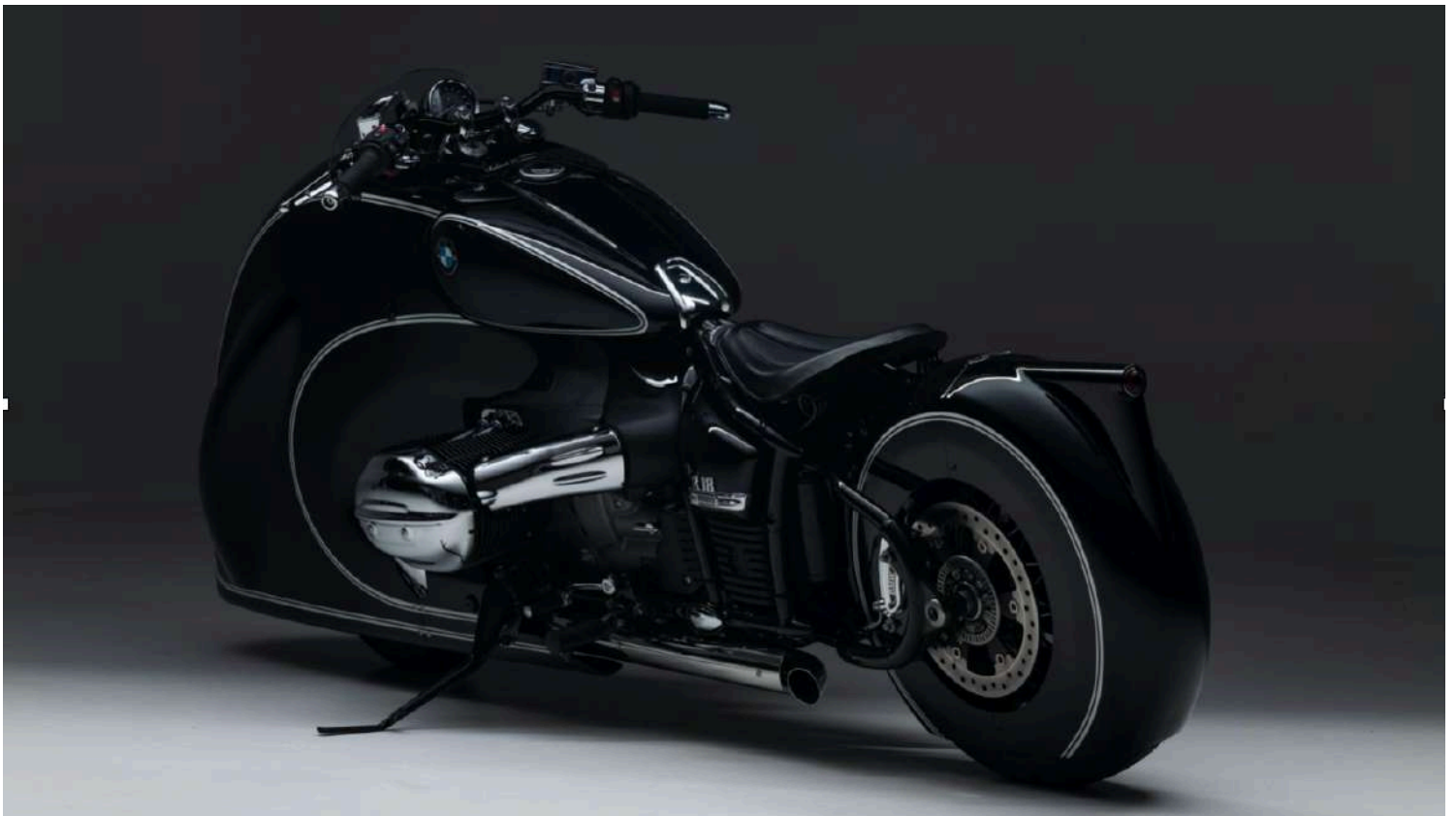
BMW R18 Custom Bike