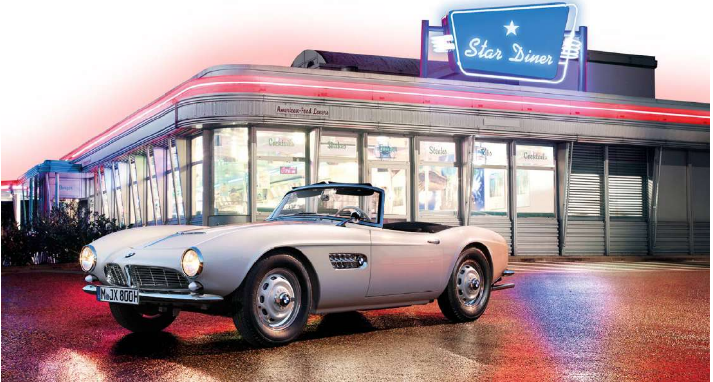
Elvis Presley's BMW 507 V8 completamente restaurado