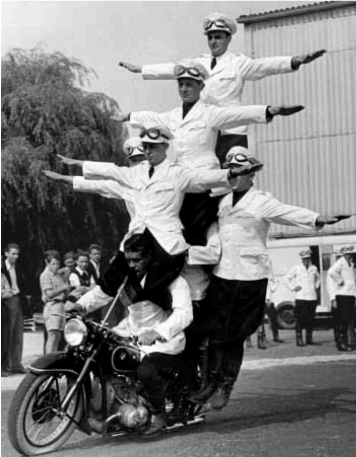
BMW Motorrad em equilíbrio

O artigo BMW Série Z continua na próxima edição: BMWCLAF NEWS 02/2021