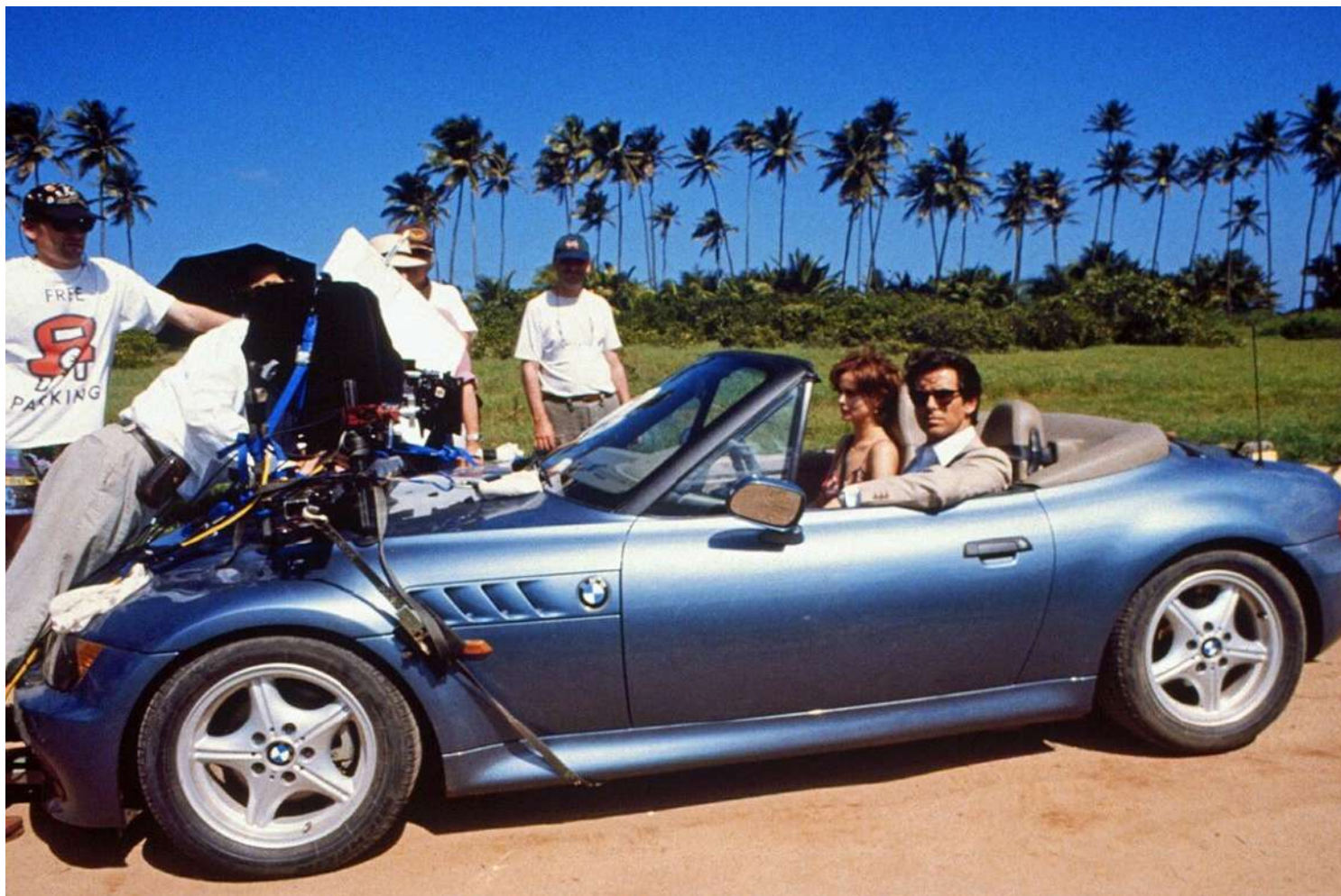
BMW Z3 E36/7 - James Bond 007

O Cupê foi fabricado a partir de janeiro de 1998 e seu chassi era 2,7 vezes mais rígido que o Roadster.