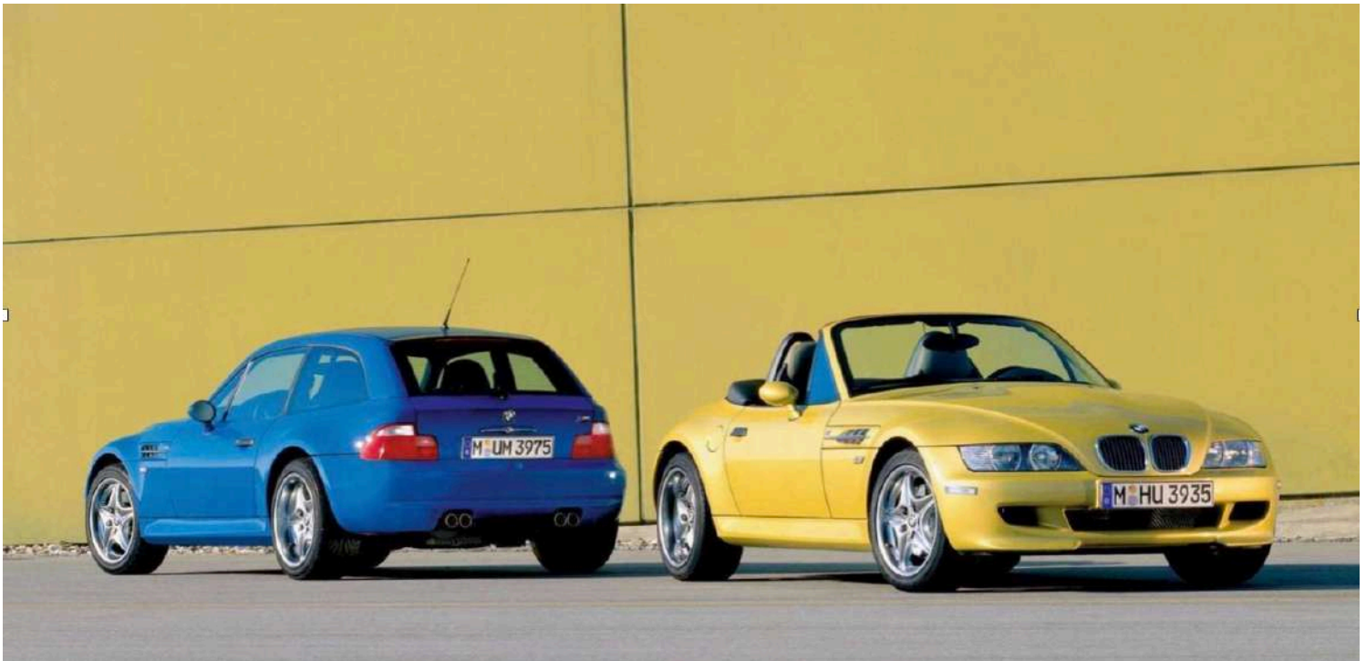
BMW Z3 M Cupê E36/7 e Z3 M Roadster E36/8