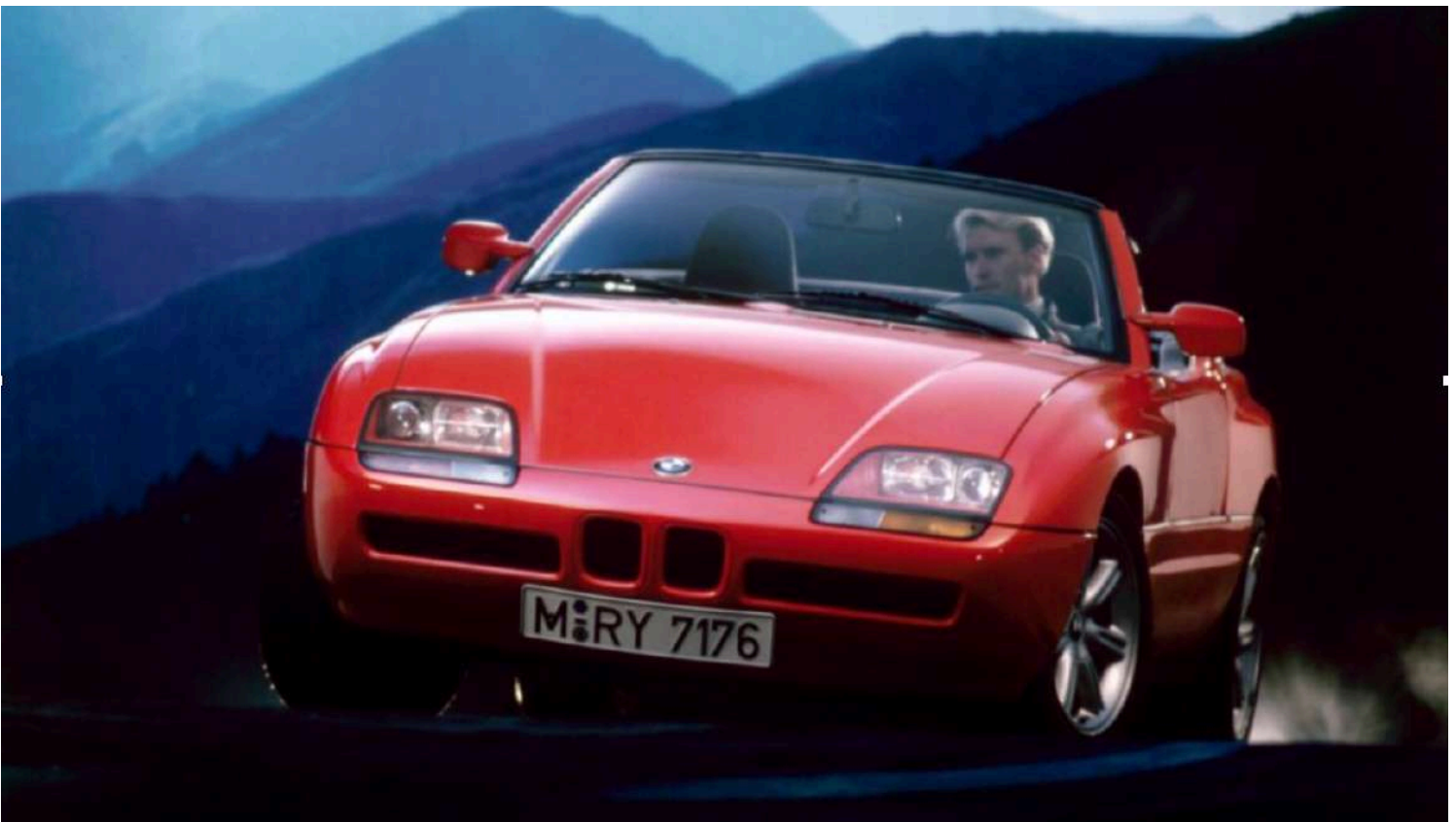
BMW Z1 E30/Z - Catálogo de vendas