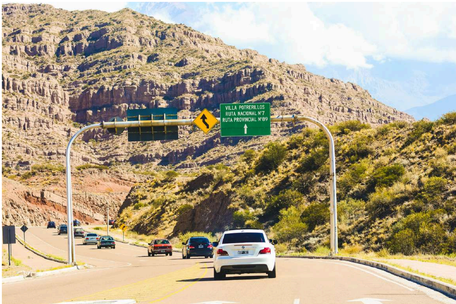
BMW Auto Club Mendoza - Passeio a Potrerillos - Abril 2018

É um dos BMW Clubs mais ativos da América Latina e seus entusiastas contam com belos modelos clássicos.