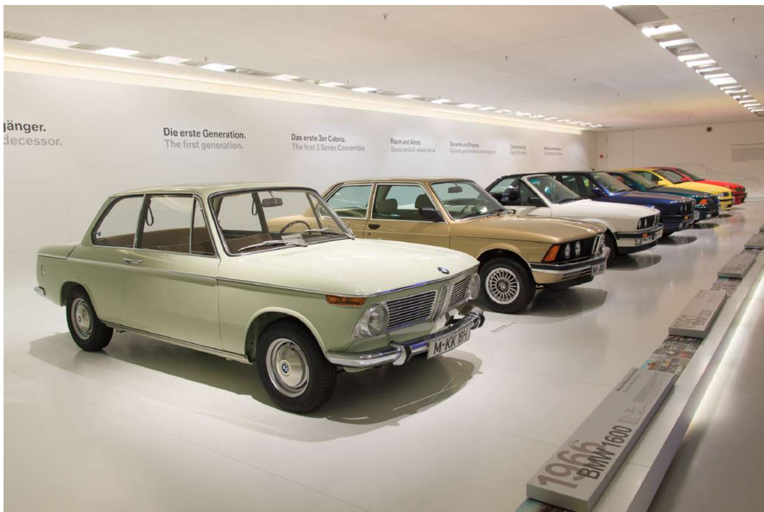
BMW Museum - Vista Interna - BMW 3 Series Evolução

A peça central do Museu BMW é a exposição permanente de 4.000 m 2 contendo cerca de 110 peças. Ele é acompanhado por exposições temporárias dedicadas a temas específicos e as questões candentes do dia. Estas exposições criam experiências, alimentam o fascínio e utilizam a informação para destacar especialmente o tema da mobilidade pessoal, explorar aspectos da história da empresa com maior profundidade e apresentar as marcas individuais do Grupo.