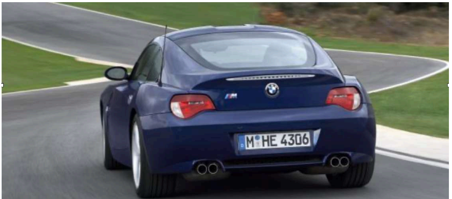
BMW Z4 M Coupe E86 343 HP's