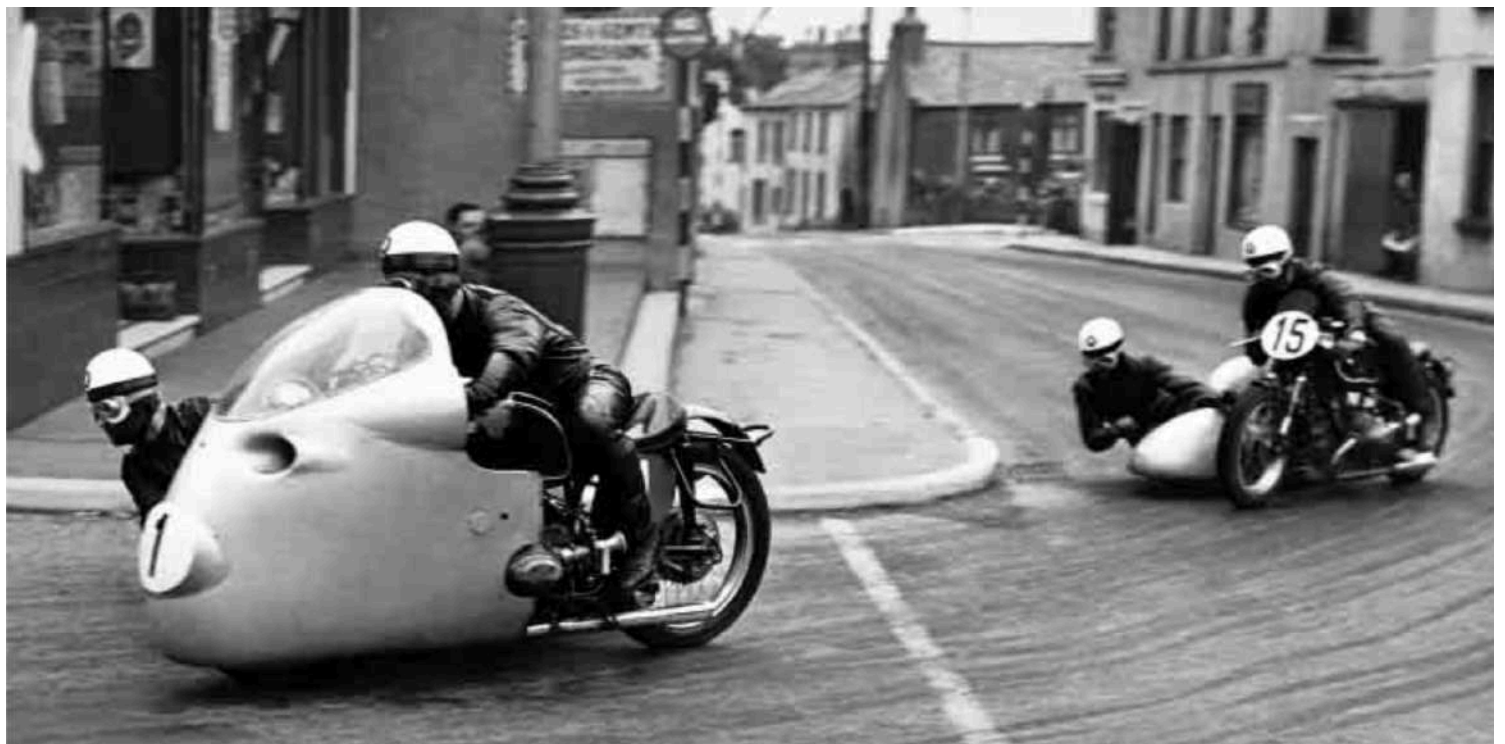
BMW Motorrad Sidecar Competindo