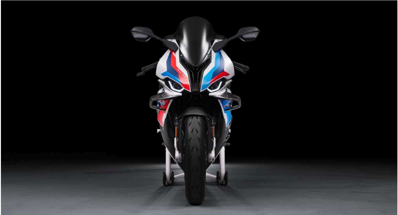
BMW M 1000 RR