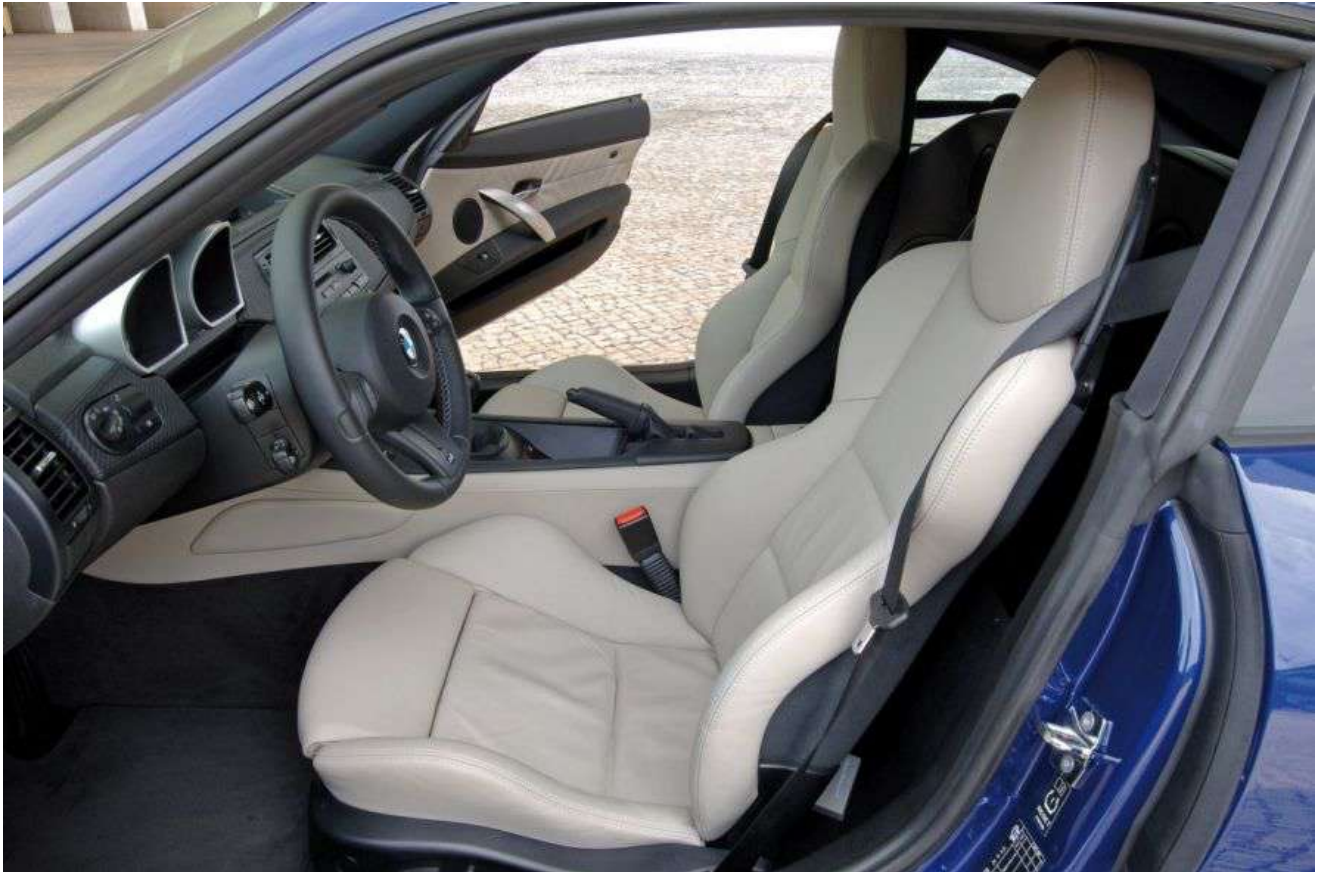
BMW Z4 M Coupe E86 343 HP's Interior