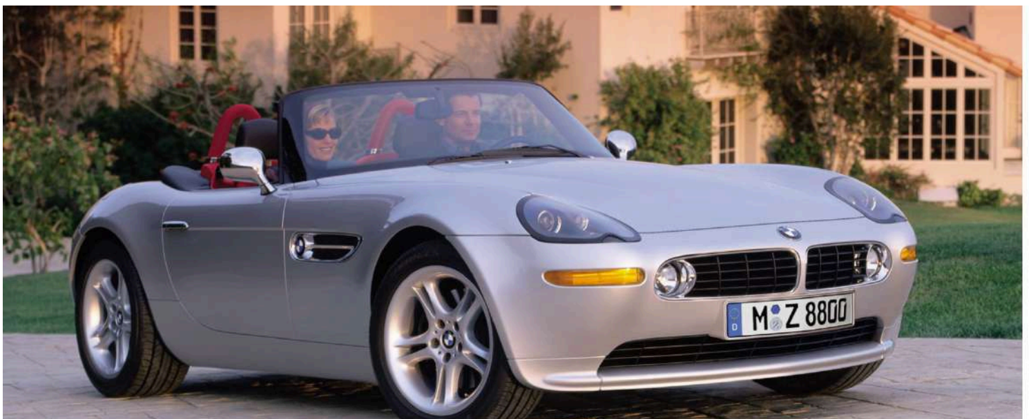
BMW Z8 Roadster E52 395 HP's