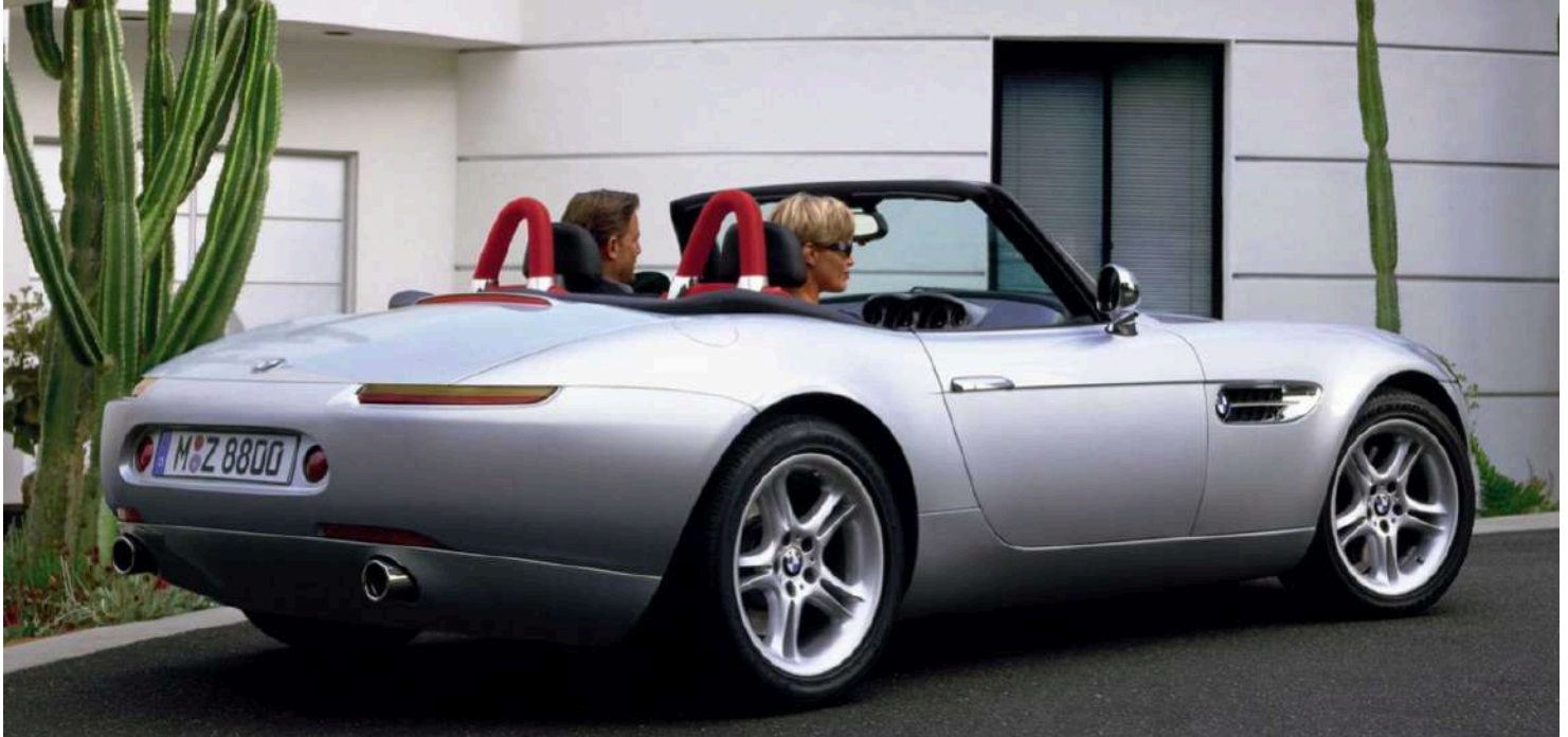
BMW Z8 Roadster E52 395 HP's