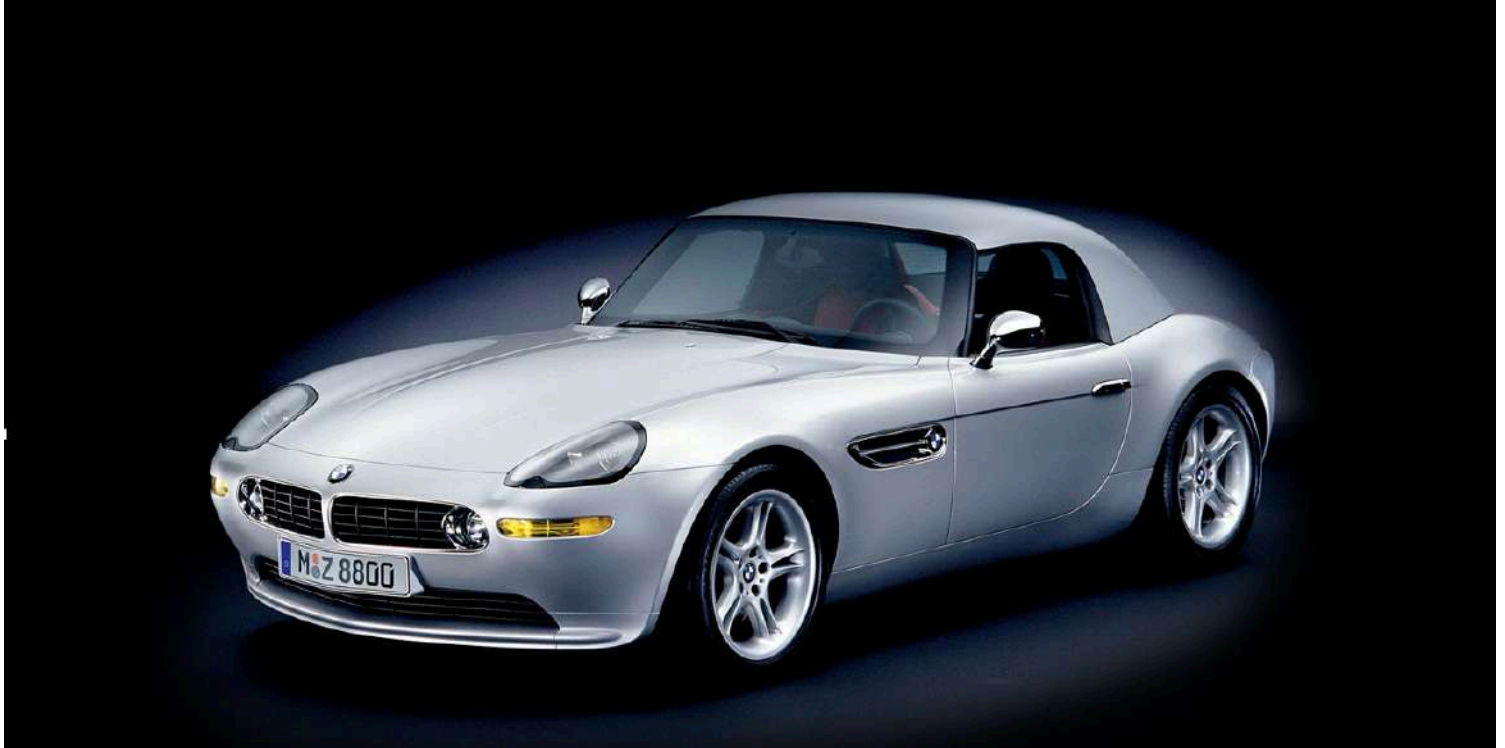
BMW Z8 Roadster E52 395 HP's com Capota Dura