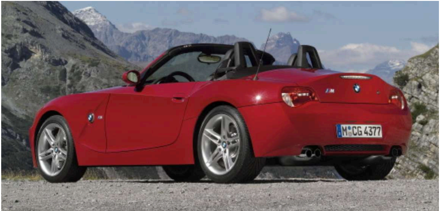
BMW Z4 M Roadster E85 343 HP's