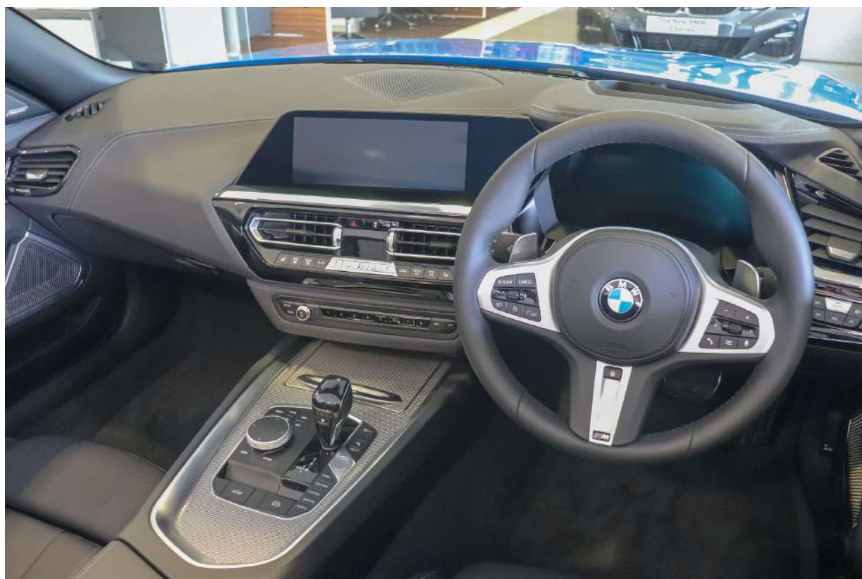
BMW Z4 G29 M40i 382 HP's Misano Blue Interior