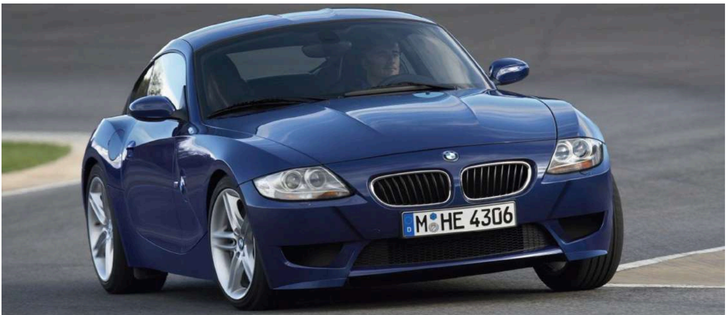
BMW Z4 M Coupe E86 343 HP's