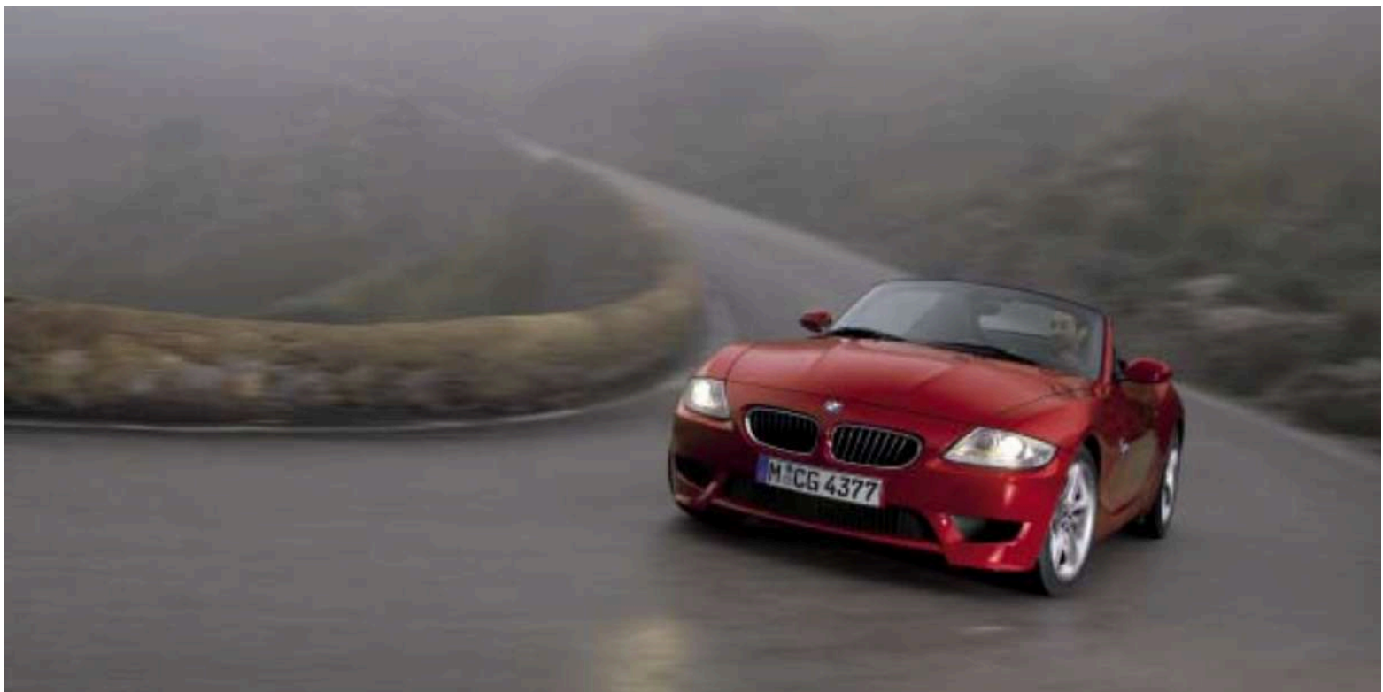
BMW Z4 M Roadster E85

O modelo M, o Z4 M, é movido pelo motor de seis cilindros em linha S54 de 343 HP's.