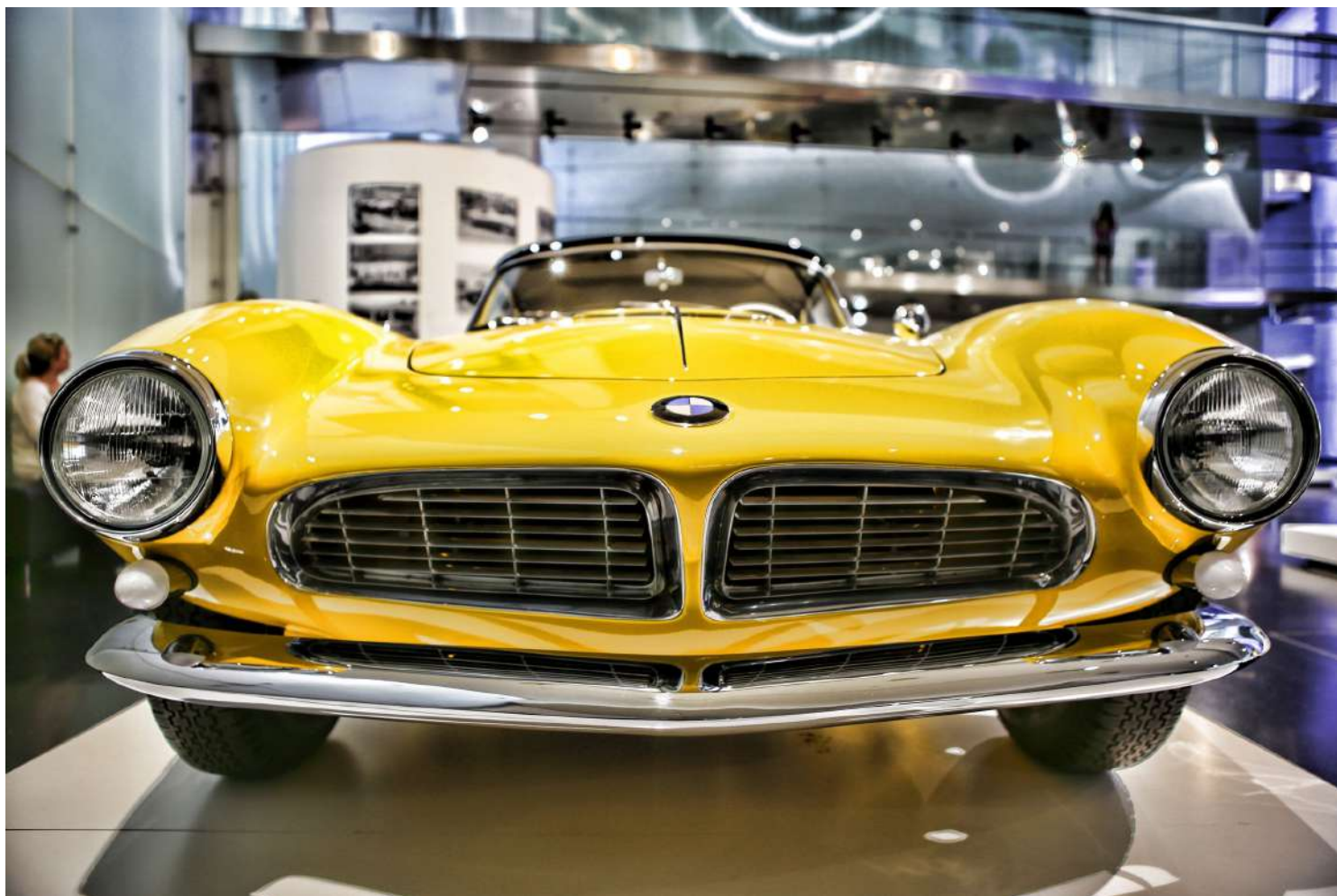
BMW Museum - Vista Interna - BMW 507 V8 Amarela

O conceito se referia a uma ideia do arquiteto Prof. Karl Schwanzer, criador do Museu BMW em 1973. Ele definiu a estrutura interna do edifício redondo como uma continuação da estrada em um espaço fechado.