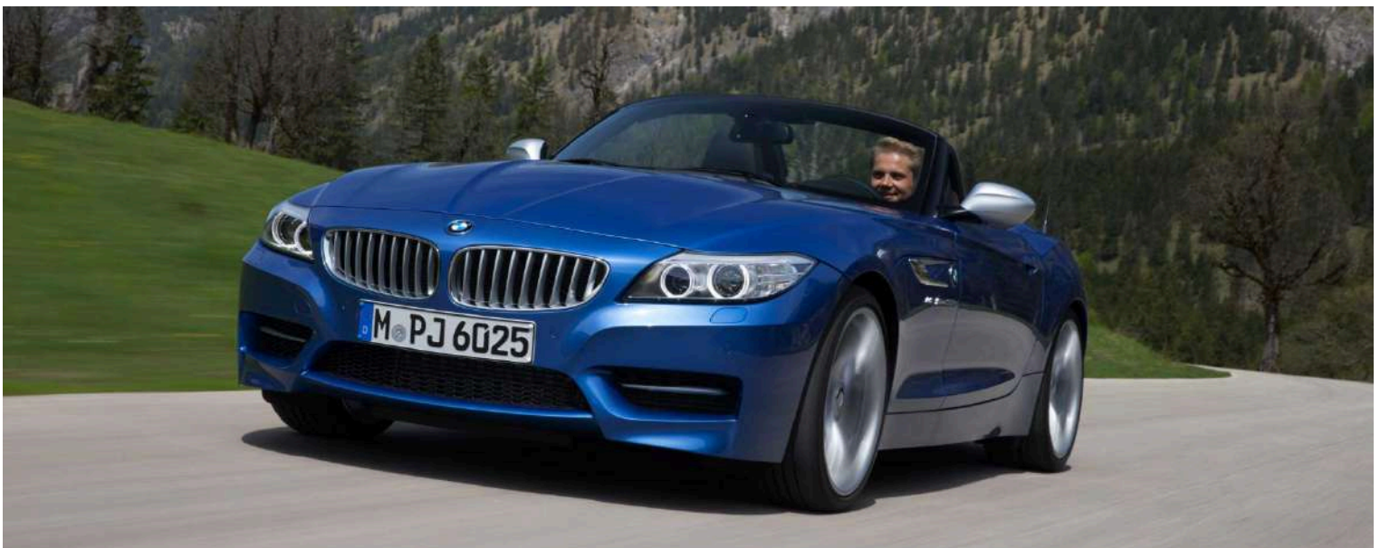
BMW Z4 E89 M3.5IS 3.0 LN54 382 HP's Estoril Blue

A versão Euro do motor Z4 MsDrive35is tinha 335 HP e a versão americana 382 HP.