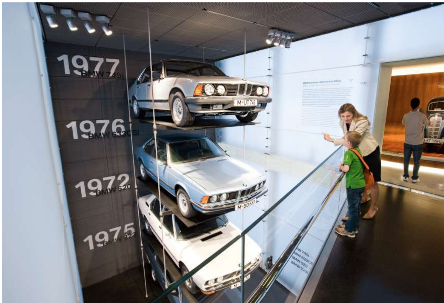
BMW Museum - Vista Interna - BMW Series 3 E21, 5 E12, 6 E24 e 7 E23

Para o mundo exterior, ele aparece como uma enorme escultura de concreto autocontida e seu interior é dominado pelo caráter de um espaço aberto, enquanto a arquitetura do prédio baixo é mais urbana por natureza. As duas seções do edifício, os prédios redondos e os prédios baixos, são conectados por uma rampa para visitantes, que leva os visitantes às 25 áreas de exposição.