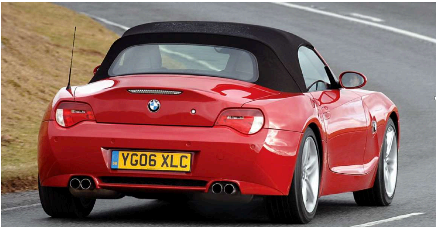
BMW Z4 M Roadster E85 343 HP's