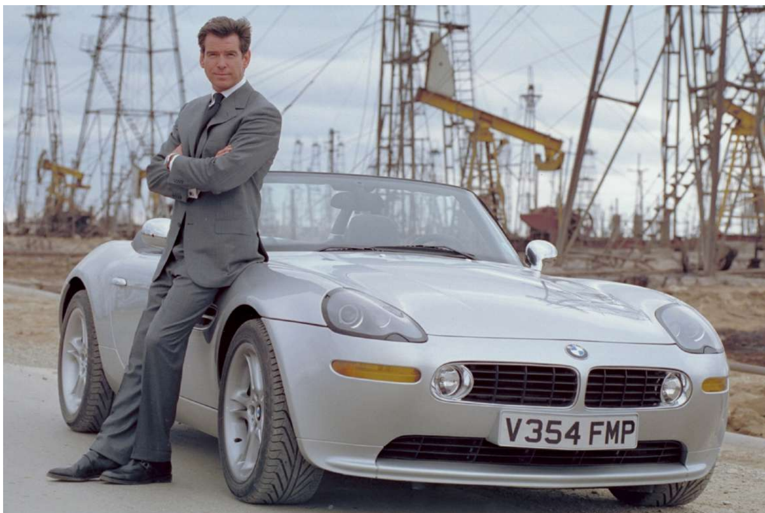
BMW Z8 Roadster E52 - James Bond 007

Depois do 328 e do 507, é o BMW Roadster mais desejado de todos os tempos.