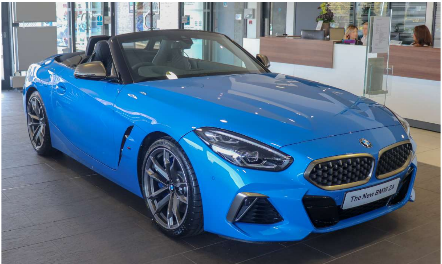
BMW Z4 G29 M40i 382 HP's Misano Blue

Os modelos sDrive são movidos pelo motor B48 de 4 cilindros em linha de 2.0 litros, enquanto o M40i é movido pelo motor B58 de 6 cilindros em linha. Todos os motores vêm com indução forçada e estão acoplados a uma transmissão automática de 8 velocidades.