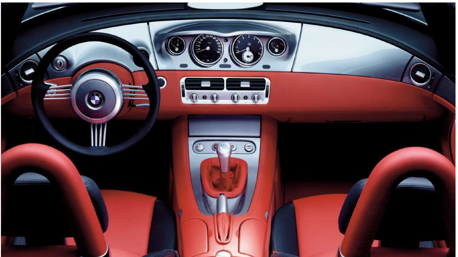
BMW Z8 Roadster E52 395 HP's Painel