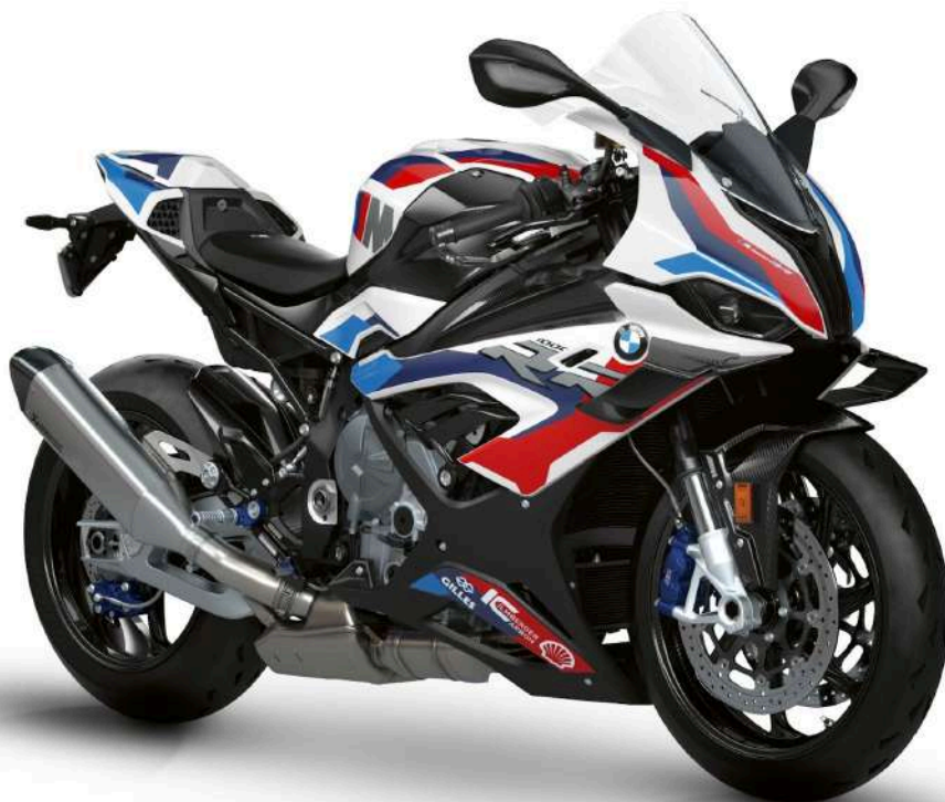
BMW M 1000 RR