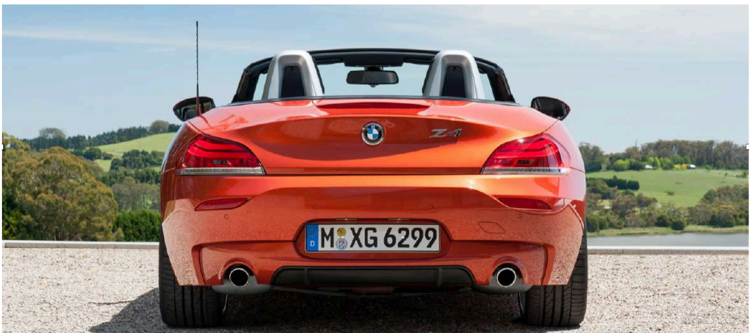
BMW Z4 E89 M3.5iS 3.0 LN54 382 HP's Valencia Orange