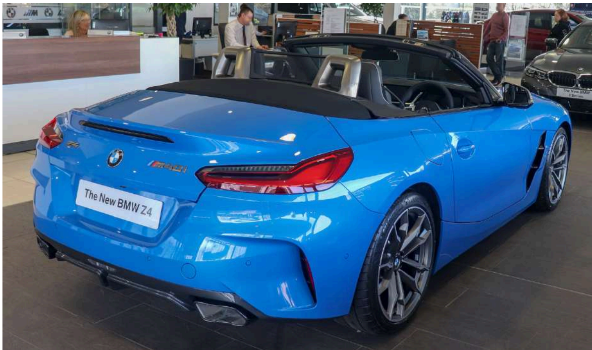
BMW Z4 G29 M40i 382 HP's Misano Blue